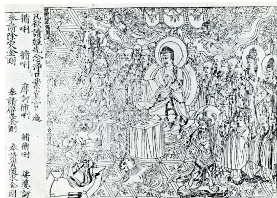
Begin van Diamanten Soetra (868 n. Chr.). Naar fotoreproductie van boekrol.

In het eerste zaaltje: aan de muur links bij het binnenkomen een fotocopy van de oudst gedateerde boekrol, de Diamanten Soetra van 868.