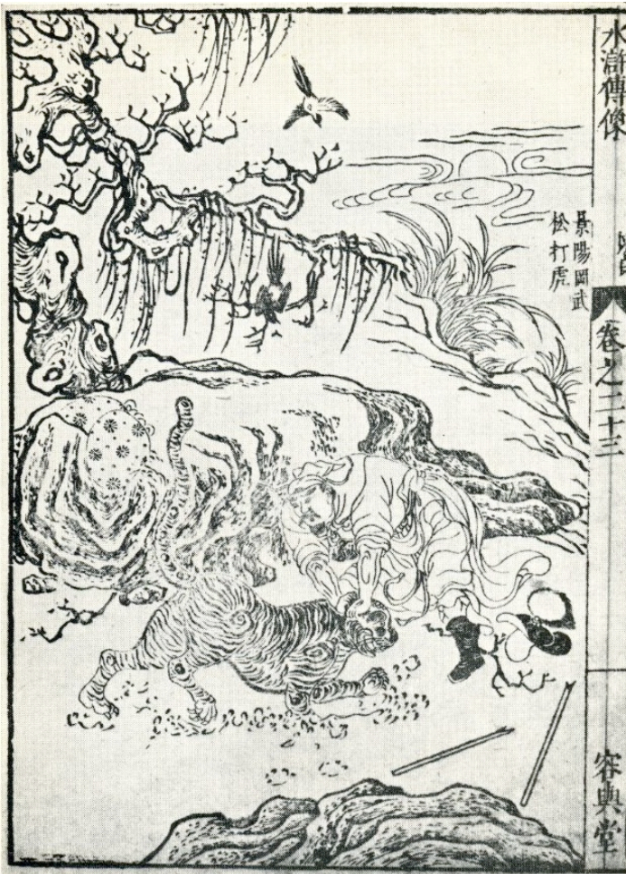
De dronken Woe Soeng doodt ongewapend een tijger uit: Sjwei-Hoe-Tsjwan, "All Men are Brothers", ed. 1953. (coll. v. Gulik)

productie van een houtsnede van de vroege Japanse prentkunstenaar Moronobu, daarop geïnspireerd. Rechts van de vitrine twee landschappen, reproducties naar Sjên Tsjow.