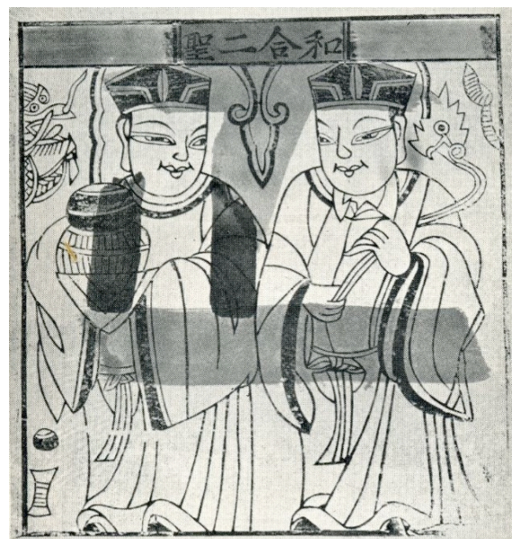
Offerprent, Peking 1941. Ho en Hê, de twee schutspatronen voor Vrede en Harmonie

In de uitgang een drietal grote offerprenten en een met de hand gekleurde blokdruk met voorstellingen uit de Boeddhistische Onderwereld.