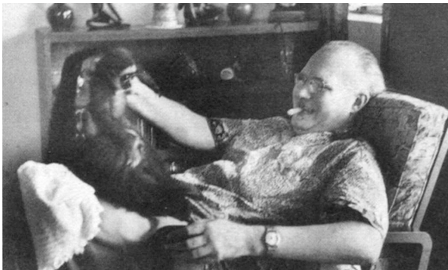
Kuala Lumpur, 1962

Ter gelegenheid daarvan zal de schrijver u in dit nummer van de nieuwsbrief zelf toespreken over diverse onderwerpen.